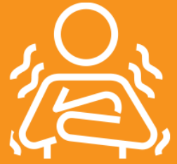
SHAKING WITH CHILLS