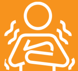
TEMBLADERA CON ESCALOFRÍOS