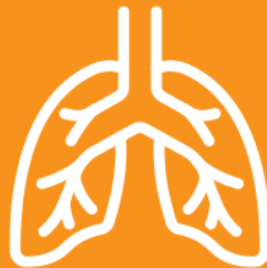
SHORTNESS OF BREATH