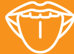
NUEVA PÉRDIDA DEL GUSTO U OLFATO